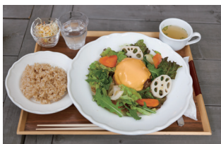
▲「ハンバーグランチ」 1,100円

お洒落で落ち着く雰囲気ブックカフェ。店内の本や雑誌は読み放題。素材にこだわった健康的なメニューばかりで、何度食べても飽きない味わいです。デザートも舌鼓を打つ美味しさ。ワインは無添加にこだわっていて、日本では珍しいフランス産を取り扱っています。一度行けば通い詰めたくなること間違いなし。